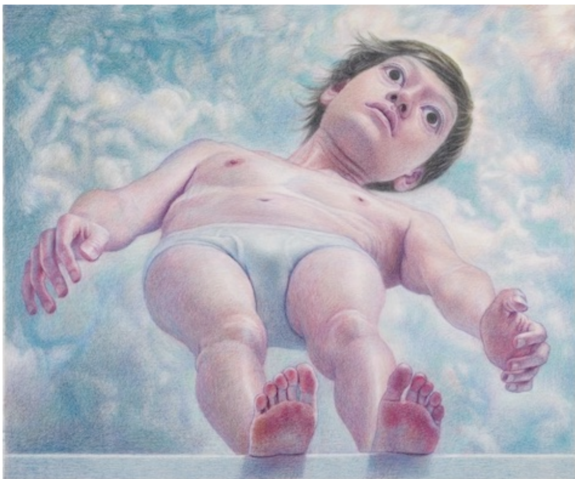
「首を曲げる」2019 紙に色鉛筆 50 x 60 cm