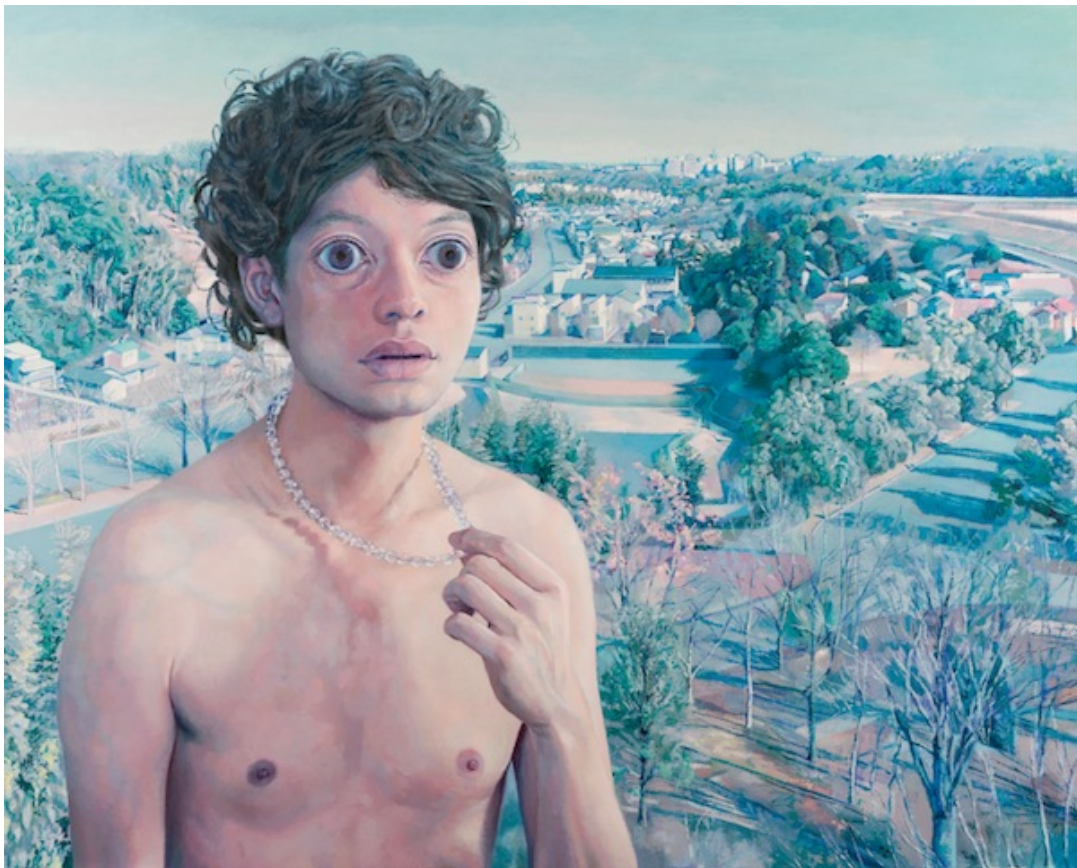
「首飾り」(2017) キャンバスに油彩 130x162cm

会期：2018年5月12日(土)～6月9日(土) 13:00 - 19:00 *日・月・火・祝日は休廊